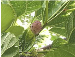
GELSO/WEIßER MAULBEERBAUM ( Morus alba ), Blütezeit April – Mai.