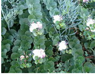
CAPPERO/ KAPERNSTRAUCH ( Capparis ovata ), Blütezeit April – September.