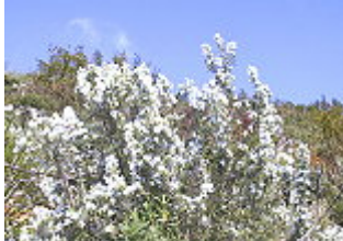
ROSMARINO/ROSMARIN ( Rosmarinus officinalis ), Blütezeit ganzjährig.

Eine Besonderheit ist am legendenumwobenen Palinuro-Kap zu finden: Hier wächst die Primula Palinurensis , die auch Symbol des Nationalparks ist.