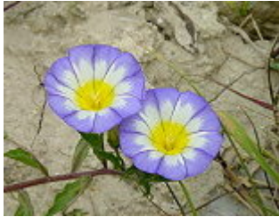
VIOLA TRICOLORE L./ DREIFARBIGE WINDE ( Convolvulus tricolor L.), Blütezeit März – Juni.