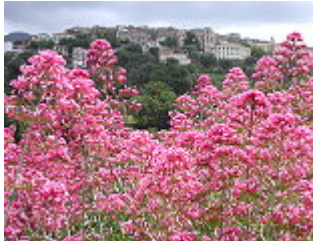
VALERIANA ROSSA/ROTE SPORNBLUME ( Centranthus ruber ), Blütezeit April – September.