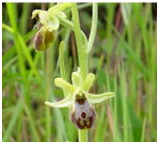
OFRIDE VERDE BRUNA/SPINNENRAGWURZ ( Ophrys sphegodes Miller), Blütezeit: Februar – Juni.