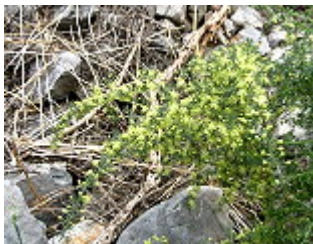
ASPARAGO PUNGENTE/ STECHENDER SPARGEL ( Asparagus acutifolius ), beliebte Delikatesse, Blütezeit Juli – Oktober.