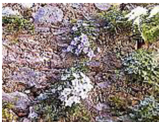
CAMPANULA FRAGILIS/ GLOCKENBLUME, Blütezeit ab Mai.