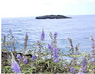
AGNO CASTO/ MÖNCHSPFEFFER ( Vitex agnus-castus ), Blütezeit Juni – November.