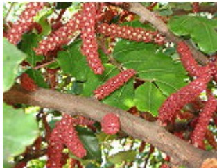
CARRUBO – JOHANNISBROTBAUM – Ceratonia siliqua – Blütezeit: August – Oktober.