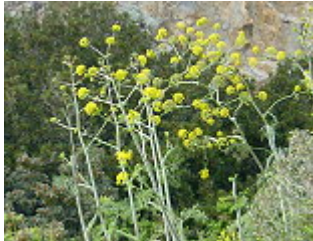
FERULA COMUNE/GEMEINES RUTENKRAUT ( Ferula communis ), Blütezeit April – Mai.