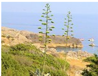
AGAVE AMERICANA/ AMERIKANISCHE AGAVE (Agavaceae), Blütezeit Mai – Juni.