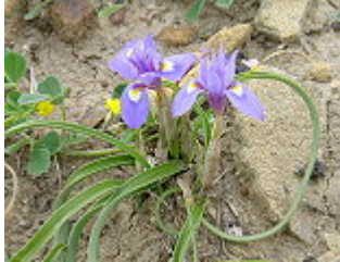
GIAGGIOLO DEI POVERETTI/ MITTAGS-SCHWERTLILIE ( Gynandriris sisyriuchium L.), Blütezeit März – Mai.