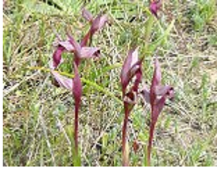
SERAPIDE LINGUA/ ECHTER ZUNGENSTENDEL ( Serapias lingua ), Blütezeit März – Mai.