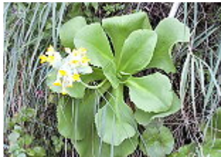
PRIMULA PALINURI/ PALINURO-PRIMEL, Blütezeit Februar – März.