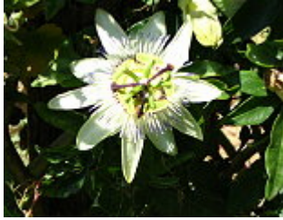
PASSIFLORA/ PASSIONSBLUME, Blütezeit Juni.