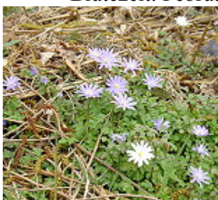
ANEMONE dell' APPENNINO/ APENNIN-ANEMONE ( Anemone apennina ), Blütezeit März – April.