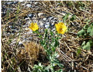
PAPAVERO CORNUTO/GELBER HORNMÖHN ( Glaucium flavum ), Blütezeit April – September.