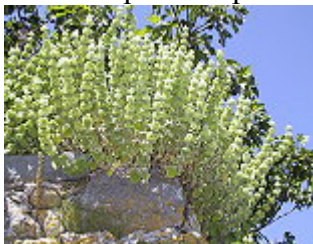
BALLOTA ORIENTALE/ ORIENTALISCHES NESSELKRAUT, Blütezeit Mai.