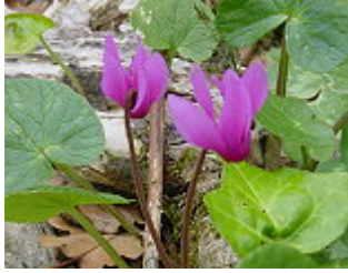
CICLAMINO NAPOLETANO/ NEAPOLITANISCHES ALPENVEILCHEN ( Cyclamen hederifolium ), Blütezeit August – November.

Diese Fotos wurden uns freundlicherweise von Wanderführer Salvatore Calicchio (s. Gruppenwanderungen) zur Verfügung gestellt.