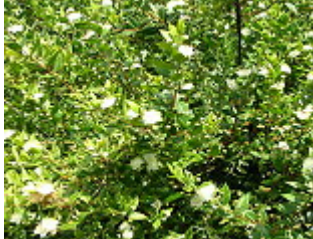
MIRTO/MYRTE ( Myrtus communis ), Blütezeit Juni – August.