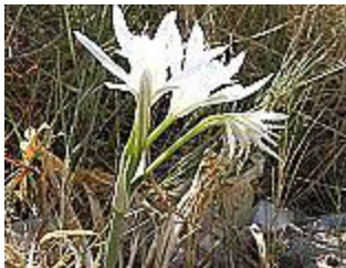
GIGLIO MARINO/ DÜNEN-TRICHTERNARZISSE ( Pancretium maritimum ), Blütezeit Juli – September.