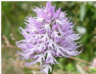
OMINI NUDI/ITALIENISCHES KNABENKRAUT ( Orchis italica ), Blütezeit März – Mai.