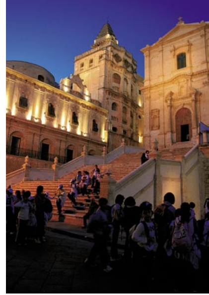
Bild oben links: Das Prunkstück von Noto ist die Cattedrale San Nicola.