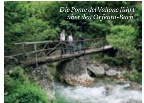
Die Ponte del Vallone führt über den Orfento-Bach.

Wie jedes Karstgebirge besitzt auch die Majella trotz reichlicher Regenfälle im Sommer und Herbst sowie Schneefall (nicht nur) im Winter wenige Wasserläufe. Wie ein riesiger Schwamm saugt sie das Wasser auf, sammelt es in Adern und Grotten und spuckt es erst zu Tal wieder aus, wo viele Quellen sprudeln. Etwa 30 Gipfel des Massivs reichen deutlich über die Zweitausendmeter-Grenze, dem höchsten, dem Monte Amaro, fehlt mit 2795 Metern nicht viel zum Dreitausender. Er und weitere knapp