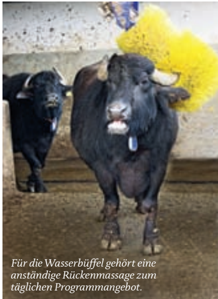
Für die Wasserbüffel gehört eine anständige Rückenmassage zum täglichen Programmangebot.

Im Norden des Cilento leben die berühmten Wasserbüffel, aus deren Milch der echte Mozzarella di bufala hergestellt wird – nicht zu verwechseln mit dem äußerlich ähnlichen, gummiartigen Produkt aus Kuhmilch, das bei uns unter dem Namen Mozzarella verkauft wird, in Italien aber „fior di latte“ genannt