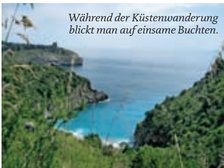
Während der Küstenwanderung blickt man auf einsame Buchten.