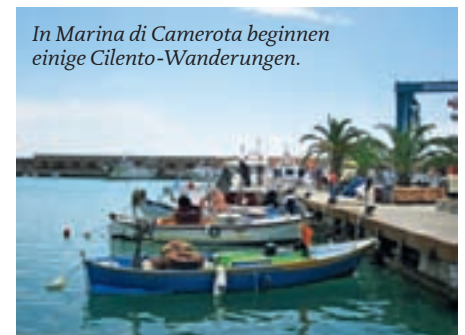
In Marina di Camerota beginnen einige Cilento-Wanderungen.

len Rückweg sparen und die üppige Küstenlandschaft vom Wasser aus betrachten können. Und auch die Rückfahrt wird zum Abenteuer: Silvano, der Fischer, lässt es sich nicht nehmen, uns die zahlreichen Grotten zu zeigen, die sich an der Küste verbergen. In manchen bricht sich das Licht in farbenprächtigem Spiel. Silvano und Salvatore sind sich sicher, dass die Grotten des